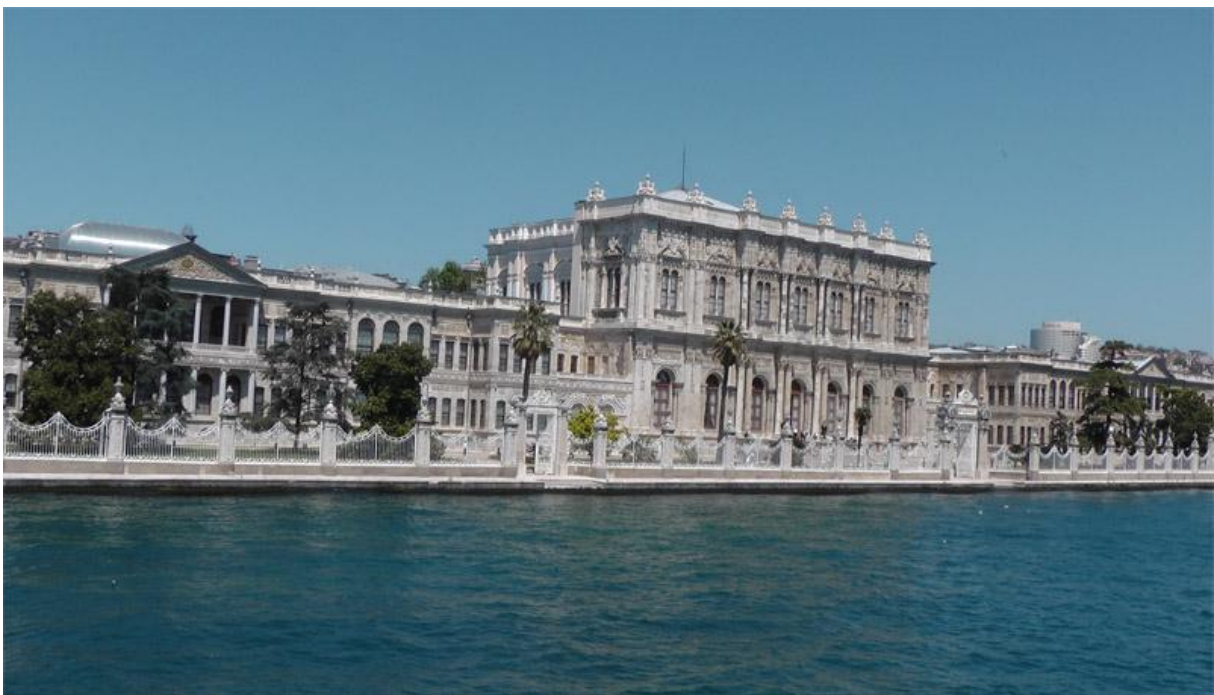
Der Dolmabahçe-Palast im Jahr 2010. Ein Teil des Palasts ist Touristen zugänglich, ein anderer Teil ist Residenz von Erdoğan

Zeitpunkt 1890, der Sultan Abdülhamid II ist 14 Jahre im Amt, das Osmanische Reich verliert die Kontrolle über alle europäischen Besitzungen und ist auch ansonsten sehr geschwächt. Der Sultan residiert im neuen Palast Dolmabahçe , der direkt am Bosphorus-Ufer liegt. Der 1856 als Zeichen der "Europäisierung" des Osmanischen Hofes gebaute Palast hat eine Länge von 600 Meter, hat eine Fläche von 45.000 m 2 , 46 Säle, 285 Zimmer, sechs Hamam und 68 Baderäume. Gebaut wurde er von Abdülhamid I, dem Vater des jetzt herrschenden Sultans.