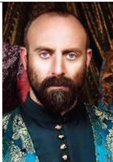
Hasan der Reiche

Du bist der Sultan des Osmanischen Reiches, 48 Jahre alt und lebst im neuen Sultans-Palast, den Dein Vater bauen ließ, direkt am Ufer des Bosphorus. Vom Fenster aus kannst Du Asien sehen, wo der Stadtteil Üsküdar liegt. Politisch hast Du große Sorgen um Dein großes Reich, aber heute ist ein freudiger Tag: Du feierst die Hochzeit Deiner Nichte Ayse. Sie wird eine gute Partie machen, da der Sohn des reichsten Kaufmanns Istanbuls ("Hasan der Reiche") Ayse heiraten wird. Dadurch erhoffst Du Dir eine Aufbesserung Deiner Staatskasse, die zur Zeit leer ist, weil Du die junge, aber verschwenderisch Baronin Beci Maan geheiratet hast.