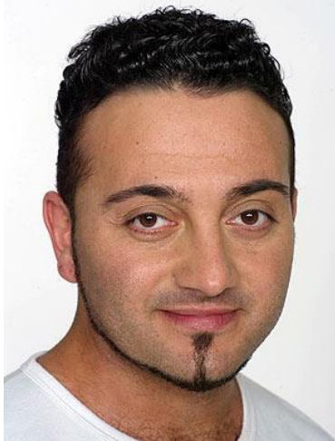
Freund von Yusuf

Du bist lebst am Hof des Sultans als Freundin und Gespielin von Ayse, der Nichte des Sultans. Obgleich es keinen offiziellen Harem mehr gibt, umgibt sich der Sultan bei Festen doch immer noch gerne mit attraktiven Mädchen, die tanzen und singen können. Ansonsten hast Du die Aufgabe, die adligen Mädchen des Hofes zu unterhalten und mit ihnen zu spielen. Du magst Ayse sehr, weil sie anders als die anderen Mädchen am Hof ist. Sie ist nicht hochnäsig und immer sehr freundlich. Nun soll sie mit einem reichen Bürgersohn aus der Stadt verheiratet werden. Sie ist aber noch viel zu jung und will noch nicht Ehefrau, Geliebte und Mutter werden. Daher haben wir Freundinnen und Ayse uns schon überlegt, wie wir beim Hochzeitsfest Ayse entführen könnten... Der Schreiber Mehmet ist dabei unser Verbündeter.