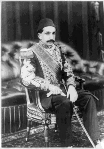
Sultan Abdülhamid II.