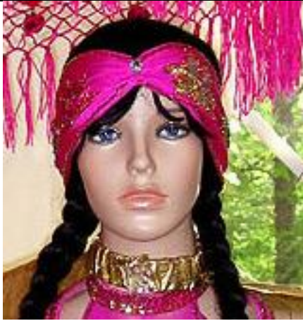
Freundin von Ayse

Du bist lebst am Hof des Sultans als Freundin und Gespielin von Ayse, der Nichte des Sultans. Obgleich es keinen offiziellen Harem mehr gibt, umgibt sich der Sultan bei Festen doch immer noch gerne mit attraktiven Mädchen, die tanzen und singen können. Ansonsten hast Du die Aufgabe, die adligen Mädchen des Hofes zu unterhalten und mit ihnen zu spielen. Du magst Ayse sehr, weil sie anders als die anderen Mädchen am Hof ist. Sie ist nicht hochnäsig und immer sehr freundlich. Nun soll sie mit einem reichen Bürgersohn aus der Stadt verheiratet werden. Sie ist aber noch viel zu jung und will noch nicht Ehefrau, Geliebte und Mutter werden. Daher haben wir Freundinnen und Ayse uns schon überlegt, wie wir beim Hochzeitsfest Ayse entführen könnten... Der Schreiber Mehmet ist dabei unser Verbündeter.