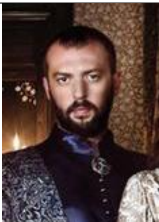
Yusuf, der Sohn des reichen Hasan

Du bist der Student Mehmet, 20 Jahre alt, und verdienst die im Hause des Sultans Geld durch Privatunterricht. Seit dir deine Schülerin Ayse erzählt hat, dass sie mit Yusuf, dem Sohn des reichen Hasan verheiratet werden soll und das ganz und gar nicht will, ist deine Liebe zu Ayse entbrannt. Du hast schon alles für eine Entführung organisiert: wenn beim Hochzeitstanz alle betrunken sind, wirst du mit Ayse tanzen, mit ihr den Palast verlassen und mit einem Boot, das deinem Freund Mustafa gehört, über den Bosphorus hinüber nach Üsküdar fliehen.