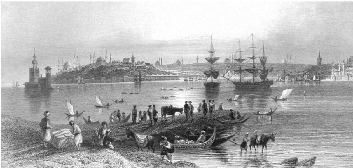
Der europäische Teil Istanbuls von Üsküdar aus gesehen (ca. 1900): links auf dem Hügel der alte Sultanspalast mit Hagia Sofia, rechts der neue Sultanspalast Dolmabahçe am Bosporus-Ufer, vorne ein Anleger in Üsküdar auf der asiatischen Bosporus-Seite

Szene 1: die Hochzeit mit einem Tanz, während dessen der Schreiber, der zu den Hochzeitsgästen gehört, die Braut entführt. Szene 2: die Bootsfahrt vom Sultans-Palast aus über den Bosporus in Richtung Üsküdar, die Verfolgung durch die Palastwachen und letztendlich das Entkommen bei strömendem Regen.