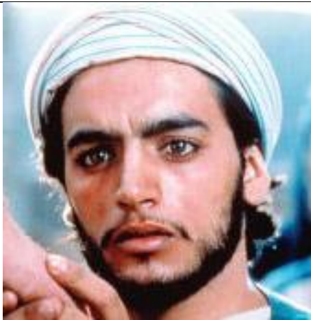
Mehmet, der Schreiber

Du bist Asye, 16 Jahre alt und lebst zusammen mit Deinen Vettern und Basen am Hof des Sultans. Du hast den Studenten Mehmet als Privatlehrer, der dir Lesen und Schreiben beibringen soll. Vor zwei Wochen hast Du erfahren, dass Du Yusuf, den Sohn des reichen Hasan heiraten sollst. Seither überlegst du zusammen mit Mehmet, wie ihr beide auf dem Hochzeitsfest, wenn alle etwas betrunken sind, abhauen könnt. Euer Plan ist, mit einem Boot, das Mehmet mieten wird, über den Bosphorus hinüber nach Üsküdar zu Freunden von Mehmet zu fliehen. Du bist ganz schön aufgeregt.