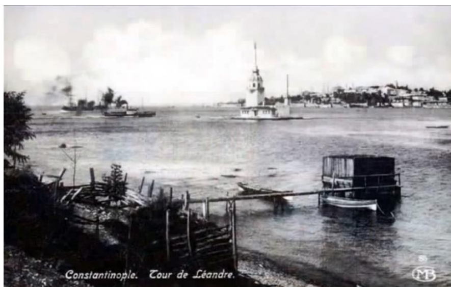
So ungefähr dürfte der Landesteg in Üsküdar ausgesehen haben!